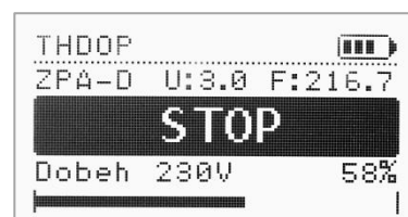
Doběh napájení Tstop